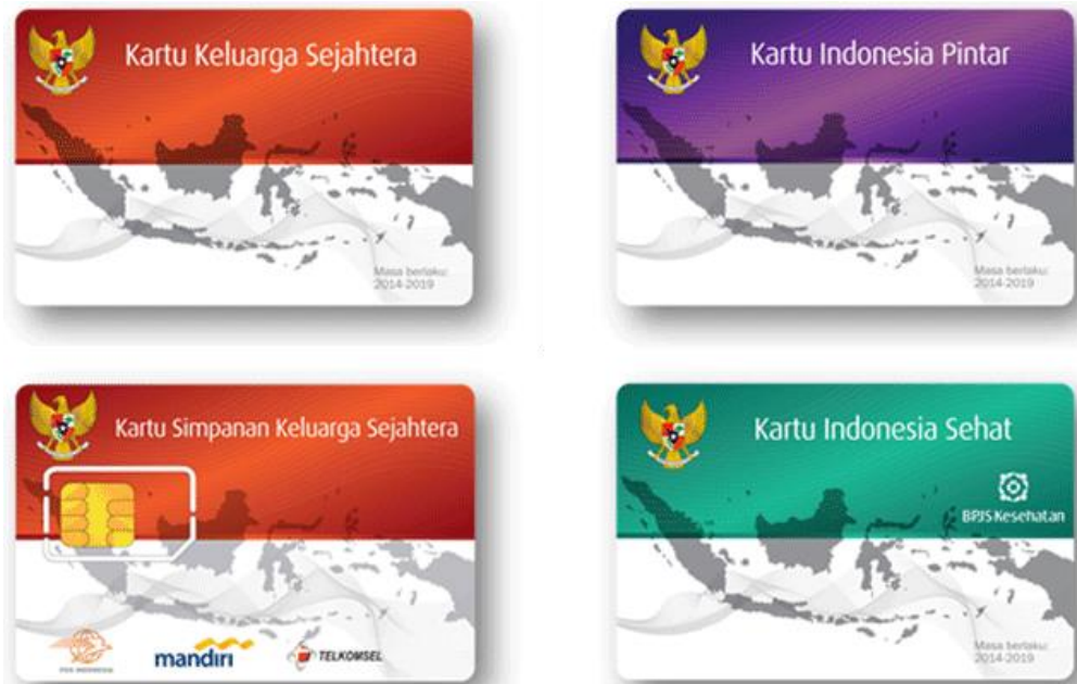
Gbr. 6.1. KIS, KIP, KSKS, KIS

Simpanan Keluarga Sejahtera, Kartu Indonesia Pintar dan Kartu Indonesia Sehat Untuk Membangun Keluarga Produktif adalah bagian dari program unggulan Pemerintah Jokowi - JK yang menandai era baru upaya peningkatan kesejahteraan masyarakat kurang mampu.